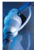
L'option injection externe permet de travailler avec certains concentrés corrosifs.

Les options permettent d'adapter au mieux le doseur aux besoins. Leur utilisation sera déterminée avec l'aide de nos services techniques.