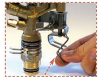
Déverrouillage simple du secteur de l'irrigation