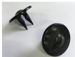
Clips de fixation pour filet - Grip Net