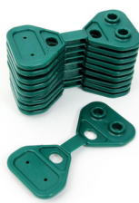
Clips de fixation - vert- 50 pièces