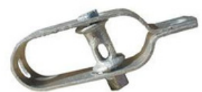
Tendeur de fil de fer n°2