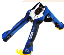
Pince à grillage avec chargeur