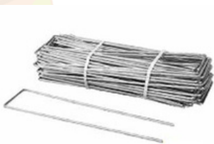
Agrafes acier pour fixation profonde - Ø6mm