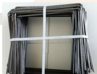
Agrafes pour toile de paillage - Ø4mm