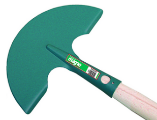
Dresse bordures demi-lune avec manche